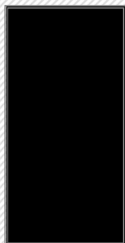
Format bleed 4 1/4" x 11"